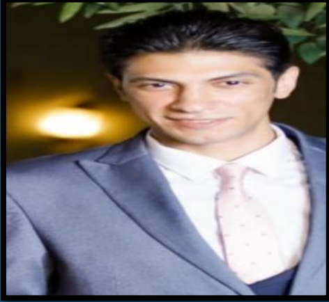
القاهرة . مصر